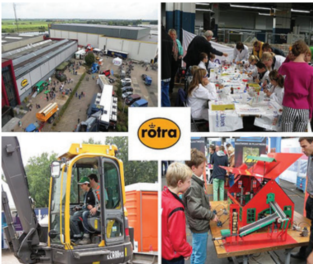
Impressies van de Techniekdag bij Rotra.